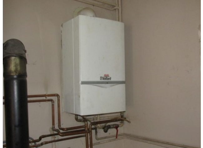
Ad 2 Bojler VAILLANT VUW 242-3