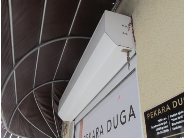
Ad 1 Rolo garažna vrata bijela 2100X2940