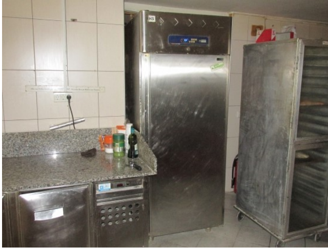
Ad 6 Rashladni ormar za pekarstvo