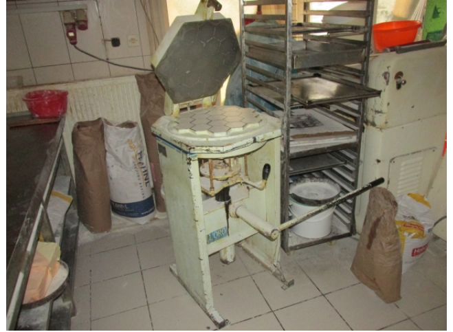
Ad 7 Stroj za dijeljenje (pekarski)